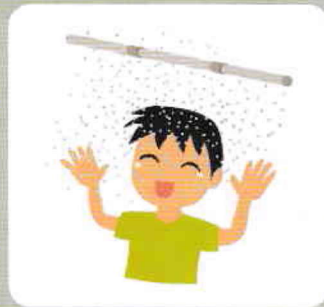
校庭にミストシャワー