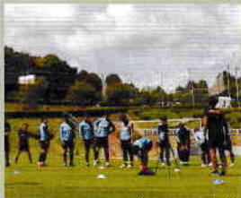
川崎フロンターレ 麻生グラウンド クラブハウス 体験会