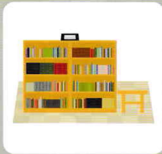
図書館を快適な空間に