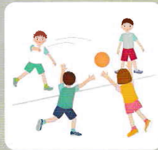
校庭の運動用具 ドッジボールなど