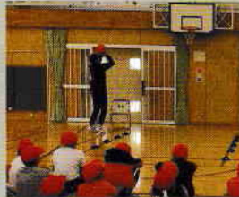
川崎ブレイブ サンダース 選手がバスケットを 教えに来てくれる券