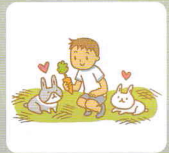
飼育小屋の環境整備 (うさぎの遊び道具、すだれをつけて暑さ対策など)